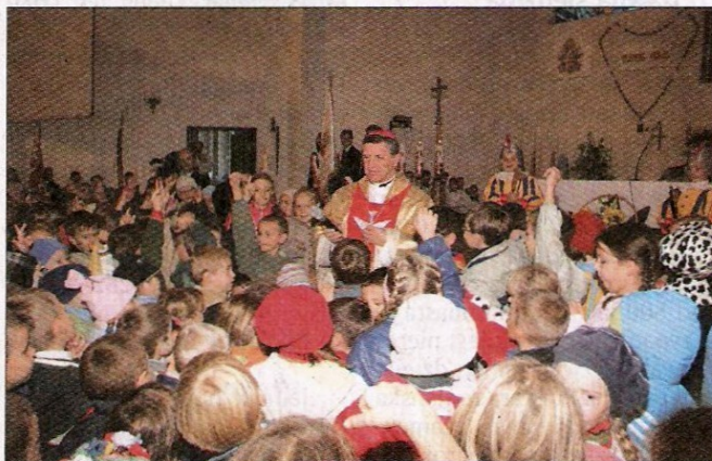
ZDJĘCIA ARCHIWUM PRZEDSZKOLA NR 3 W STASZOWIE